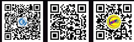
洁净煤技术公众号 电子期刊 煤炭行业知识服务平台